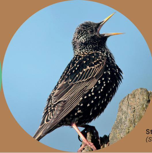
Star ( Sturnus vulgaris )

Die beste Zeit für Naturschutz ist jetzt